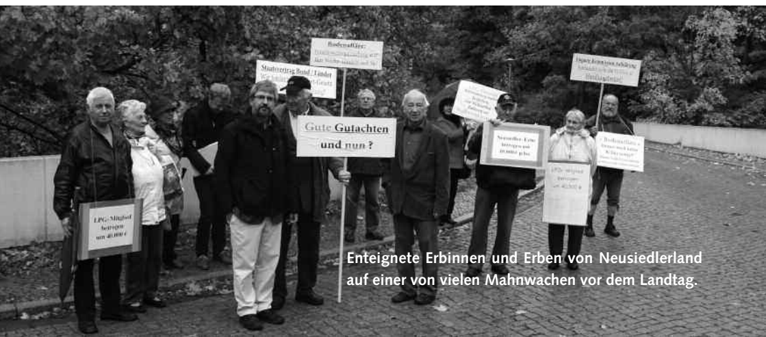
Enteignete Erbinnen und Erben von Neusiedlerland auf einer von vielen Mahnwachen vor dem Landtag.

Mit dem 2. Vermögensrechtsänderungsgesetz von 1992 und abhängig von der Umsetzungspraxis in den Ländern standen viele dann plötzlich vor dem Nichts. Mehr noch: Im Vertrauen auf ihre Eigentümerposition wurde häufig der Rechtsweg beschritten; am Ergebnis änderte dies in der Regel nichts, bis auf die zusätzliche finanzielle Last durch entsprechende Verfahrenskosten.