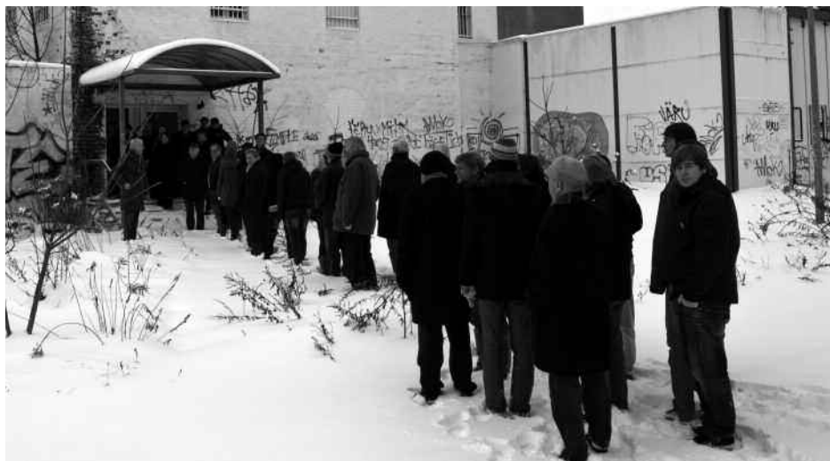
Die Enquetekommission vor Ort im ehemaligen Gefängnis und heutigen Menschenrechtszentrum Cottbus.