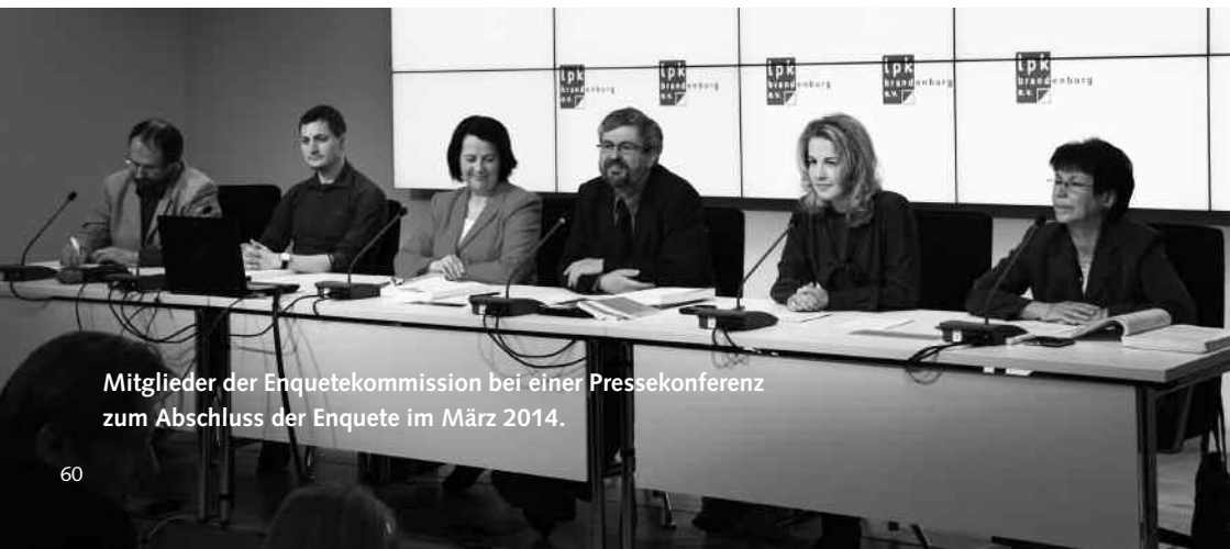
Mitglieder der Enquetekommission bei einer Pressekonferenz zum Abschluss der Enquete im März 2014.

Die Enquetekommission 5/1 empfiehlt eine ernsthafte Debatte über das DDR-Zwangsdoping und dessen Folgen für die Betroffenen bis zum heutigen Tag. Der Landessportbund wird aufgefordert, konkrete Initiativen für Dopingopfer zu entwickeln und dabei auch eine geeignete Interessenvertretung der Dopingopfer weitgehend zu unterstützen und die zugesagten Mittel auszureichen."