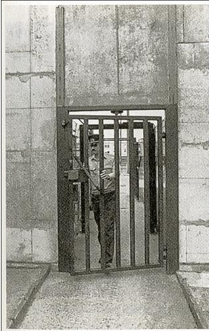
Schleuse zwischen Disziplinarteil und Verwahrteil der Militärstrafgefangenen, 1989

© Rüdiger Wenzke: „Ab nach Schwedt“, Ch. Links Verlag