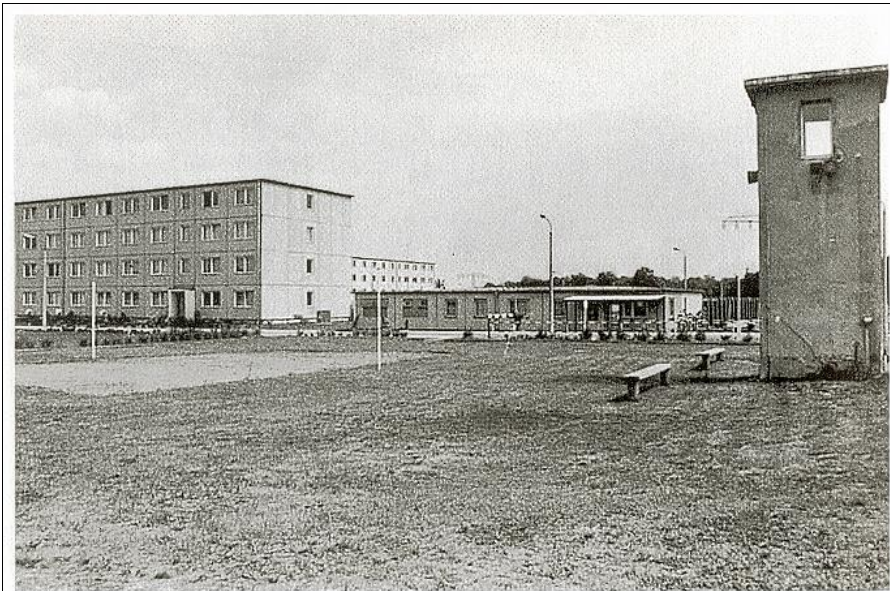
Blick auf das Stabsgebäude und die Wache der Disziplinareinheit, im Hintergrund das Unterkunftsgebäude für Disziplinarbestrafte, Ende 1980er Jahre

© Rüdiger Wenzke: „Ab nach Schwedt“, Ch. Links Verlag