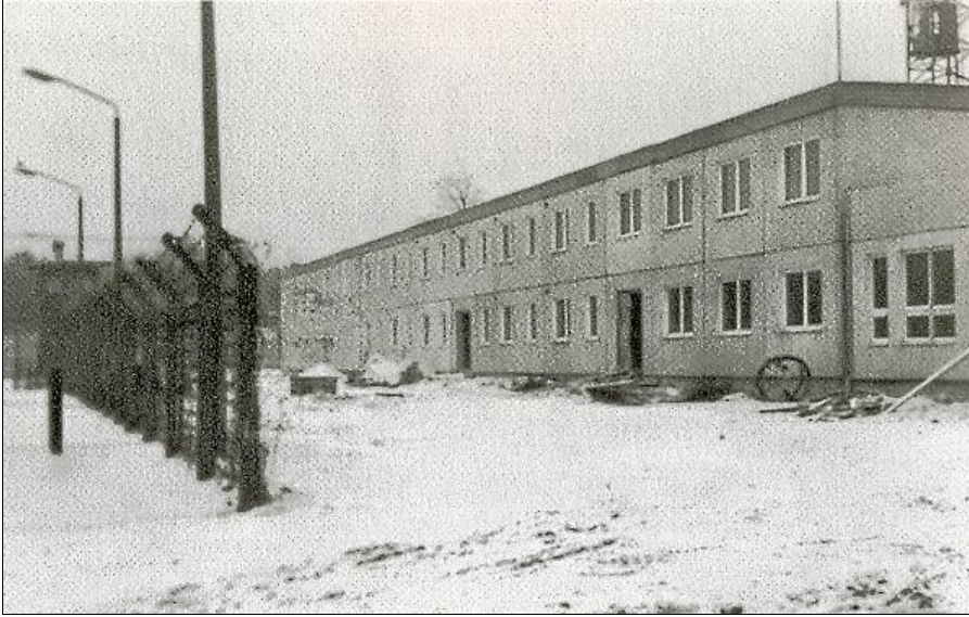
Bau des neuen Unterkunftsgebäudes für Militärstrafgefangene, 1988

© Rüdiger Wenzke: „Ab nach Schwedt“, Ch. Links Verlag