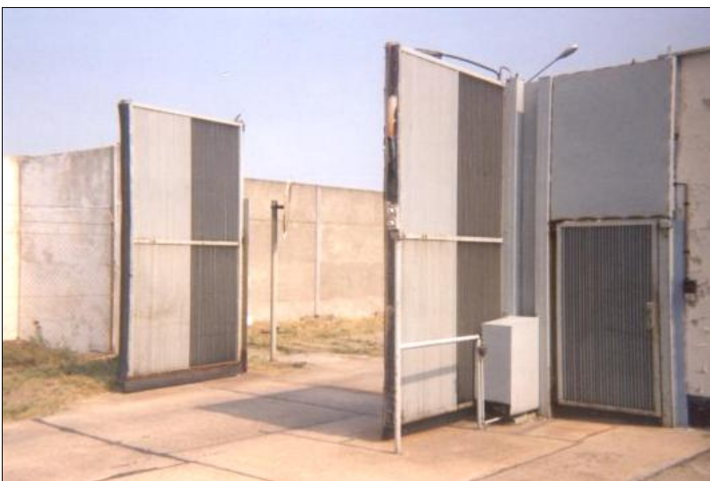
Neue Schleuse am alten TKP (Außen)