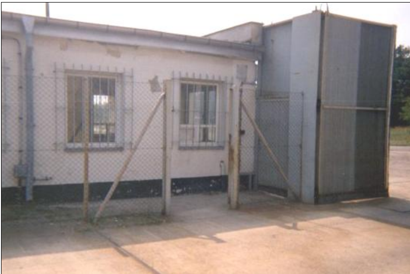
Neue Schleuse am alten TKP (Innen)